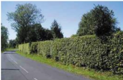
haie constituée d'essences indigènes en été