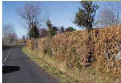
haie constituée d'essences indigènes en hiver