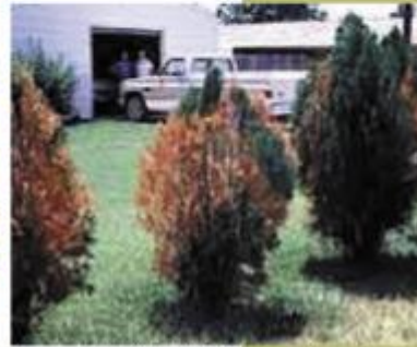
thuyas atteints par le biprestres du genévrier