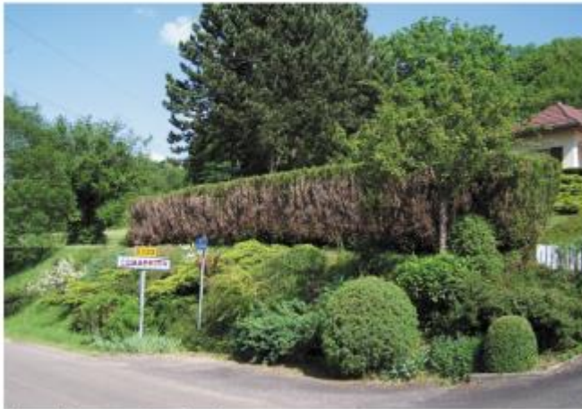
haie de thuyas après taille de «rattrapage»

Ne pas oublier que les thuyas ne sont pas des arbustes, mais des arbres qui peuvent atteindre 20m de hauteur. Contrairement à l'If, ils ne repoussent pas après une taille de «rattrapage»... Pensez aux futurs litiges avec vos voisins !...(cf. réglementation)